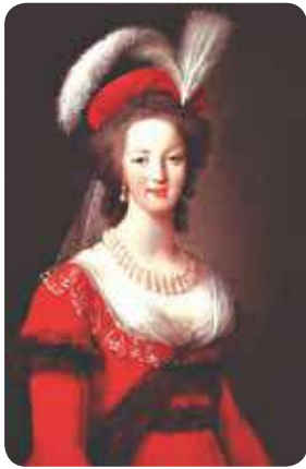
María Antonieta, reina de Francia.

Por ello, tras cuidadosa preparación, el 28 de julio de 1794, un grupo de convencionales, encabezados por FOUCHÉ y TALLIEN dieron un sorpresivo golpe, denominado del “Termidor”, por haber ocurrido en ese caluroso mes, así llamado según el nuevo calendario republicano.