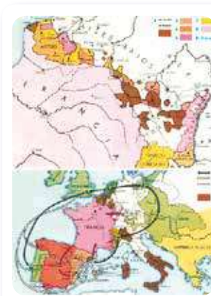
Mapa de la expansión de Francia

Los nobles refugiados en el extranjero continuaban abiertamente tramando planes para sofocar la Revolución y habían logrado reunir numerosas tropas concentrándolas sobre las fronteras de Francia. Frente a esta situación, la Asamblea francesa exigió a sus vecinos Austria y Prusia que cesara esta constante provocación y ante su negativa, en abril de 1792, los girondinos, confiando en que una pronta victoria afianzaría la Revolución, les declararon la guerra.