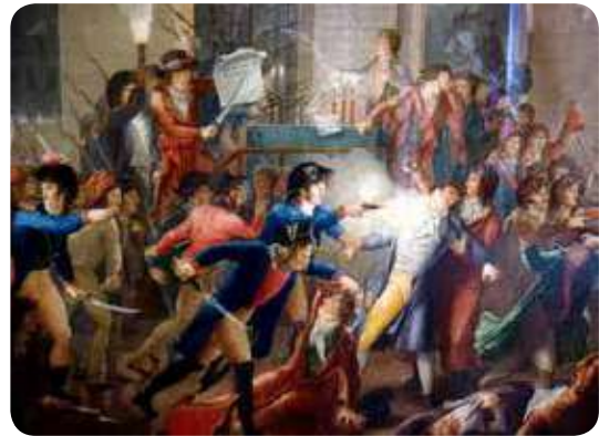
Robespierre, gobierno del Terror

Por ello, toda Francia comenzó a ver su salvación en el joven general BONAPARTE que, constituido entonces en jefe del ejército del interior, parecía reunir todas las condiciones deseadas.